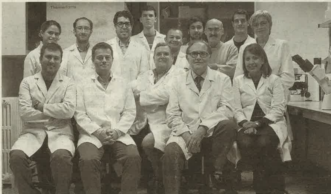
Personal del grupo de ingeniería tisular del departamento de Histología de la Universidad granadina.

Para construir la piel artificial, los investigadores han utilizado, además de este nuevo tipo de epitelio de revestimiento, un biomaterial de fibrina y agarosa previamente diseñado y desarrollado por el grupo granadino. La investigación se ha llevado a cabo en los laboratorios de la Facultad de Medicina y la Unidad Experimental del Hospital Universitario Virgen de las Nieves del Com-