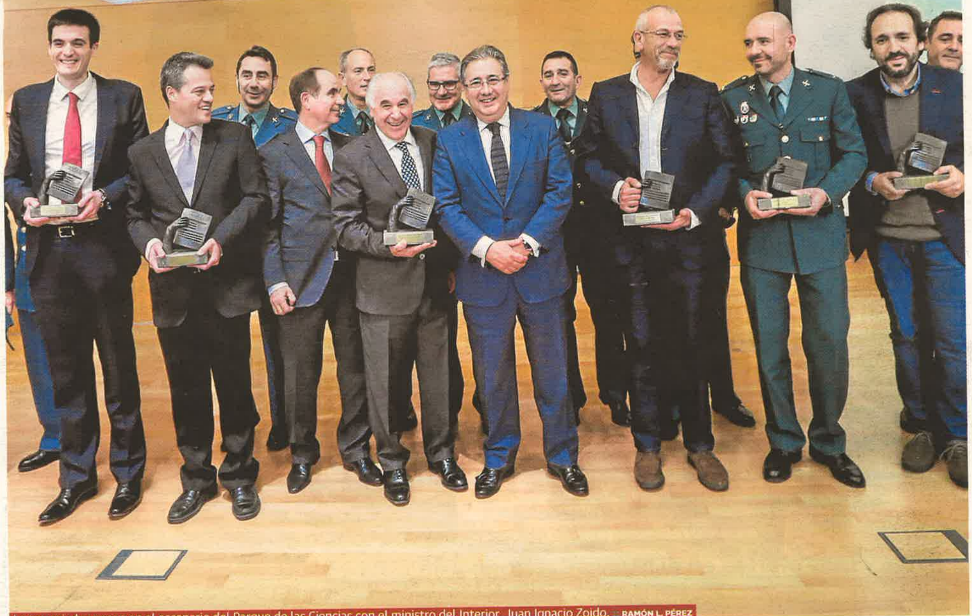
Los premiados posan en el escenario del Parque de las Ciencias con el ministro del Interior, Juan Ignacio Zoido.

El auditorio del Parque de las Ciencias acoge la entrega de los premios IDEALES, que estuvo presidida por el ministro del Interior, Juan Ignacio Zoido